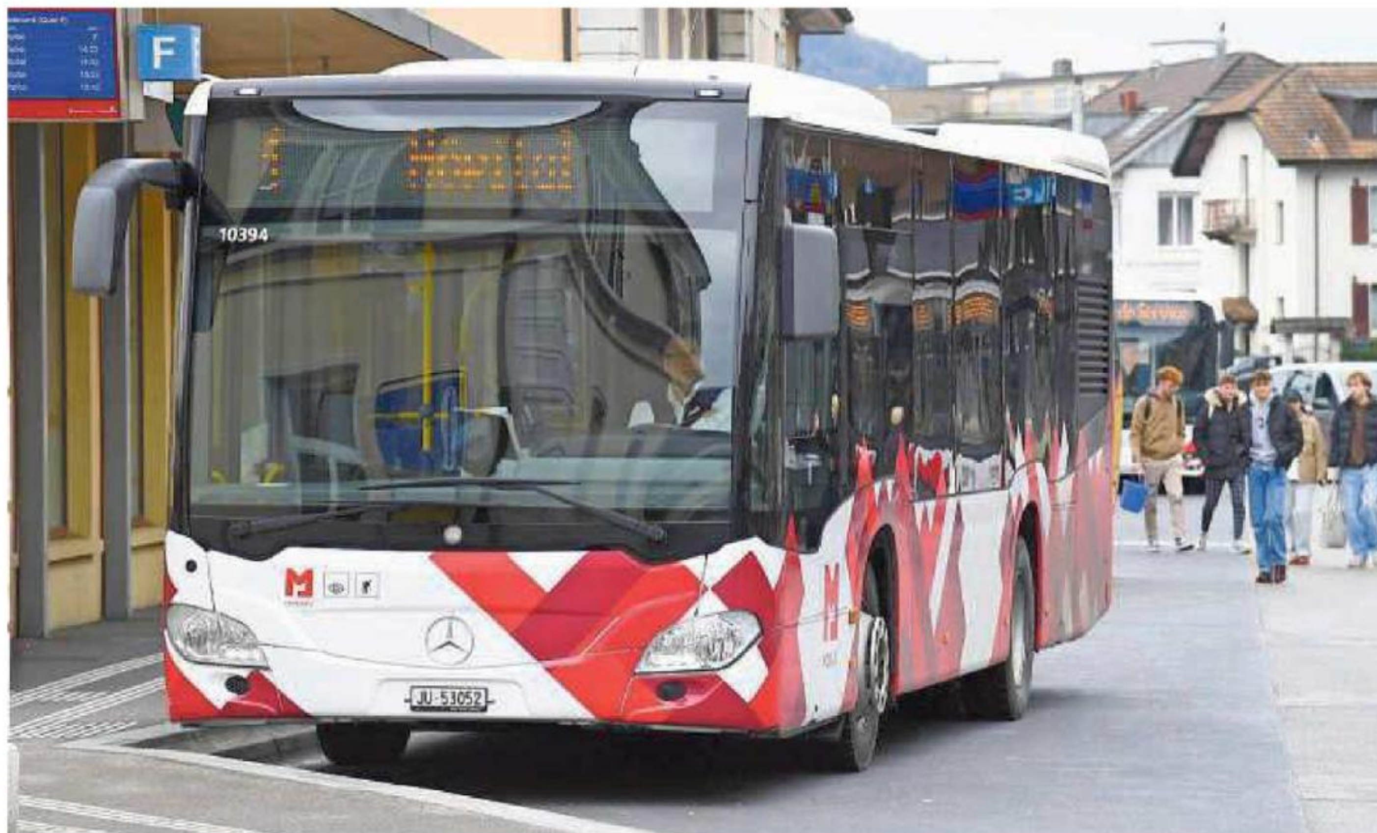
La gratuité des transports publics est anticonstitutionnelle, a tranché le Tribunal fédéral. En conséquence, les voyageurs doivent désormais payer leur billet le samedi à Delémont.

Alors que le nouvel horaire des TUD apporte toujours son lot de chamboulements, il en est autrement avec celui de 2024. Il s'agit à un poil près d'une copie de celui de l'année précédente. Il y a seulement une deuxième grosse nouveauté, soit la concentration